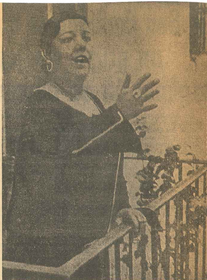
La Niña de los Peines cantando saetas desde el balcón de una casa sevillana. Primera figura femenina sin discusión en la historia del cante flamenco, sus saetas fueron muy celebradas

Manuel Centeno fue, ciertamente, un extraordinario saetero, cuyas actuaciones en la Semana Santa de Sevilla —la más famosa del mundo— en las décadas segunda y tercera de nuestro siglo hicieron época y crearon escuela, surgiendo cantaores y pléyade que le imitaban lo mejor que podían,